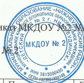
График функционирования ВСОКО в МКДОУ № 2 на 2021 год

УТВЕРЖДЕН приказ МКДОУ № 2 от 11.01.2021 г.