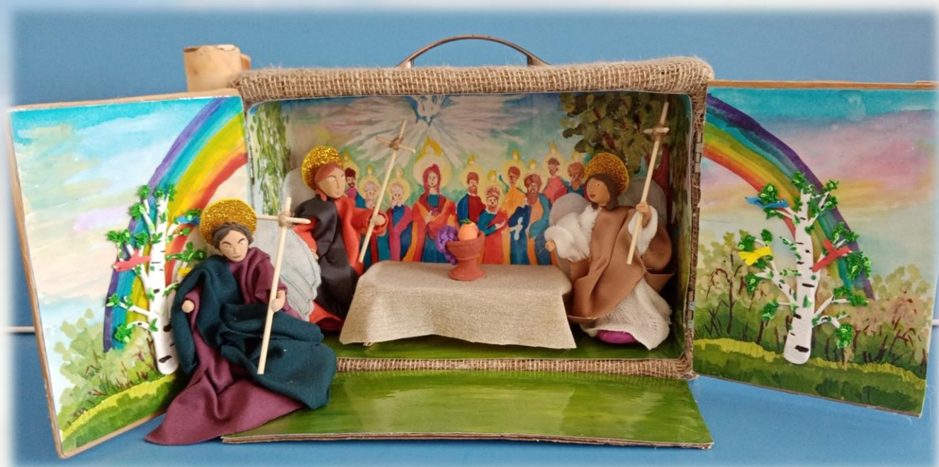
Схождение Святого Духа